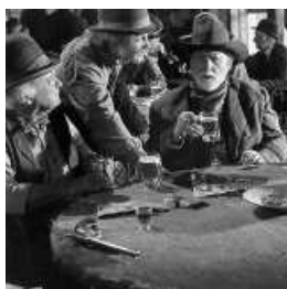
Le p'tit vieux n °1 et le p'tit vieux n °2